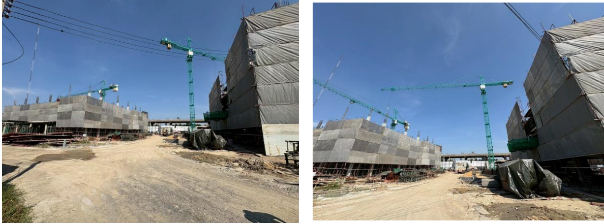
รูปที่ 1.4-1 กิจกรรมการก่อสร้างและสภาพปัจจุบันของโครงการ ประจำเดือนกรกฎาคม-ธันวาคม พ.ศ. 2568

การดำเนินงานปัจจุบัน โครงการก่อสร้างอาคารพักอาศัย พร้อมสิ่งอำนวยความสะดวกของ สำนักงาน ปลัดกระทรวงกลาโหม (พื้นที่บางจาก (พื้นที่ 1)) เป็นการดำเนินงานในระยะก่อสร้าง แสดงดังรูปที่ 1.4-1